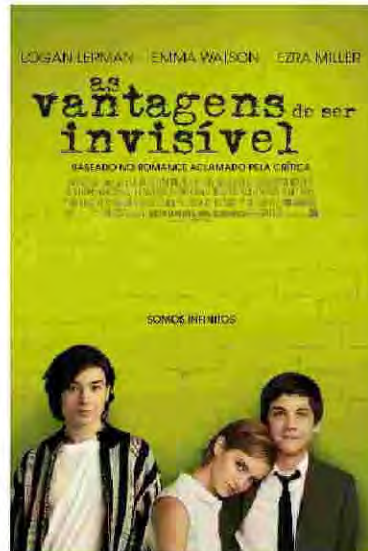
As vantagens de ser invisível Drama/Romance Estreia: 8 de novembro