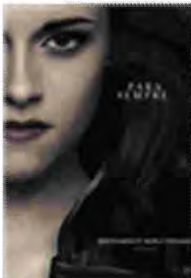
Saga Twilight: Amanhecer parte 2 Aventura/Fantasia Estreia: 15 de novembro