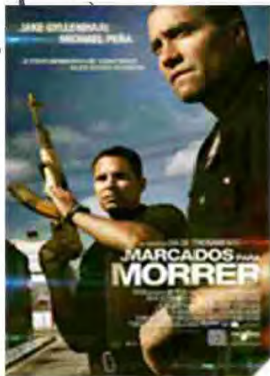
Marcados para morrer Drama/Mistério Estreia: 22 de novembro