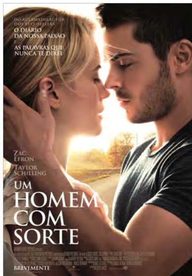
Um homem com sorte Drama Estreia: 26 de Abril