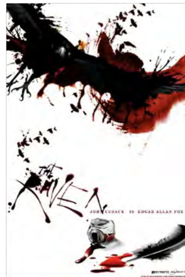
O Corvo Thriller Estreia: 25 de Abril