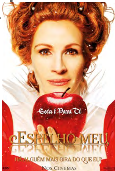
Espelho meu, espelho meu: há alguém mais gira do que eu? Aventura/Comédia Estreia: 12 de Abril