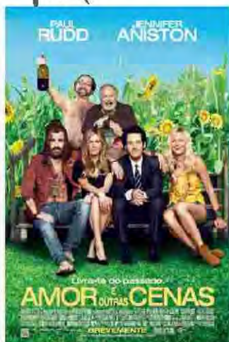
Amor e Outras Cenas Estreia dia 15 Comédia