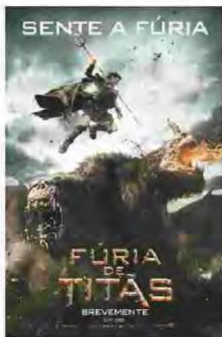
Fúria de Titãs Estreia dia 29 Ação