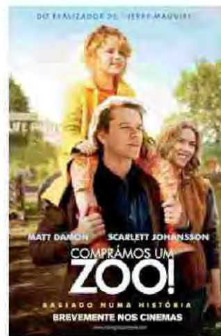
Comprámos um Zoo Estreia dia 29 Comédia/Drama