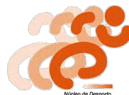
Núcleo de Desporto

O Núcleo de Desporto da ESTeSC conta contigo para a participação nas atividades e mesmo a sua organização.