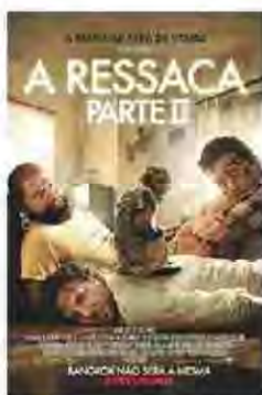
A Ressaca – Parte II