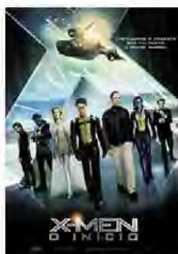
X-men: O início