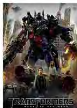
Transformers 3: O lado oculto da lua