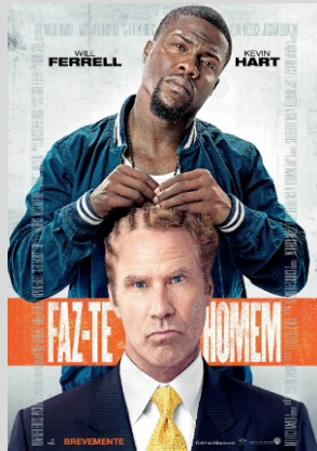
Faz-te Homem Comédia 23 Abril