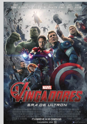
Os Vingadores: Era de Ultron Ação/Aventura/Fantasia 29 Abril