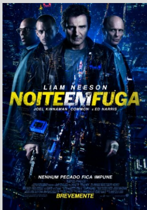
Noite em Fuga Ação/Crime/Drama 16 Abril